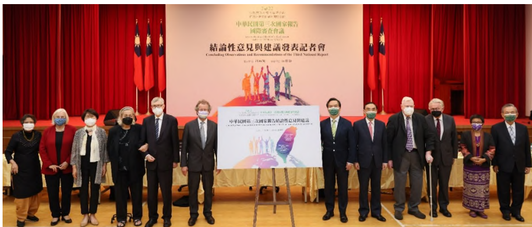
圖：111年5月13日結論性意見與建議發表記者會大合影