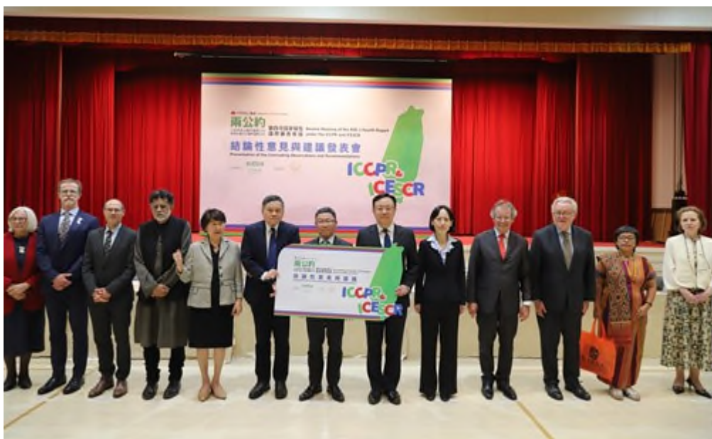
圖：115 年 5 月 15 日第四次國家報告國際審查會結論性意見發表

四、第四次國家報告國際審查：專家們審查我國提出的國家報告、民間團體平行報告、問題清單回應等資料後，提出 135 點結論性意見與建議。在本次審查過程中，法務部致力於落實我國自主建立的「在地審查模式」，建構一個讓民間團體與專家及政府機關間平等對話的專業平臺。透過這場極具深度的民主對話，各行政機關不僅呈現了近年來在各項人權指標上的人權成績單，更在密集、精彩的詢答中，與國際委員共同識別出制度深化的方向。法務部在此過程中扮演關鍵的溝通橋樑，協助各部會精確對應國際人權公約之規範，將多元觀點辯證後的產出，轉化為推進我國法治持續進化的契機。此次國際審查會議，不僅是檢視過去 4 年進展的關鍵時刻，針對我國人權現況提出多項具建設性之結論性意見與建議，內容涵蓋生命權保障、多元族群權利及當代新興人權挑戰等關鍵領域。這份集結國際專家智慧的報告，由兩委員會正式遞交，並由行政院林政務委員明昕代表中華民國政府受領。林政務委員於受領時向全體專家表達感謝，並強調行政團隊審視這份建議書後，以務實、穩健及貼近民意的方式，引領各政府機關秉持積極的態度，深化人權治理，維護全體國民的人權。為了讓全民共同見證這場人權盛事，本次會議全程提供線上直播及同步翻譯，期盼國人與國際社會共同關注臺灣在深化人權、追求公義上的堅定努力。