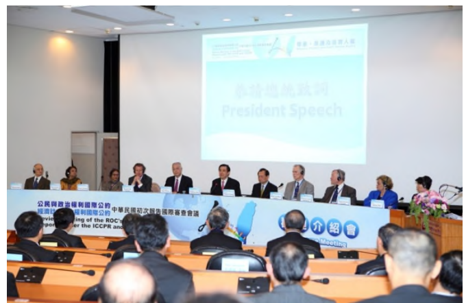
圖：102 年 2 月 24 日馬前總統英九、吳前副總統敦義、曾前部長勇夫出席中華民國初次人權報告國際審查會議歡迎介紹會

內容：我國於 101 年 4 月 20 日完成並發表初次國家人權報告，因我國已非聯合國會員國，無法依聯合國模式提交報告及接受審查，乃獨創自行邀請國際人權專家來臺參與國際審查會議之模式，分別於 102 年 2 月 25 日至 27 日、106 年 1 月 16 日至 20 日及 111 年 5 月 9 日至 13 日由 10 位國際人權專家，來臺進行初次、第二次及第三次國家報告之國際審查。延續此一模式於 115 年 5 月 11 日至 15 日再次邀請 12 位國際人權專家來臺進行第四次國家報告之國際審查。四次之國際審查會議，國際人權專家就我國政府機關與民間團體提出之國家報告、平行報告與問題清單之回應及平行回應等資料，及公民社會關注之議題，與政府機關代表及民間團體交換意見、展開建設性對話，希藉此機會協助改善我國人權現況及提供建議，藉此建立國際人權對話平臺，俾與國際人權體系接軌。