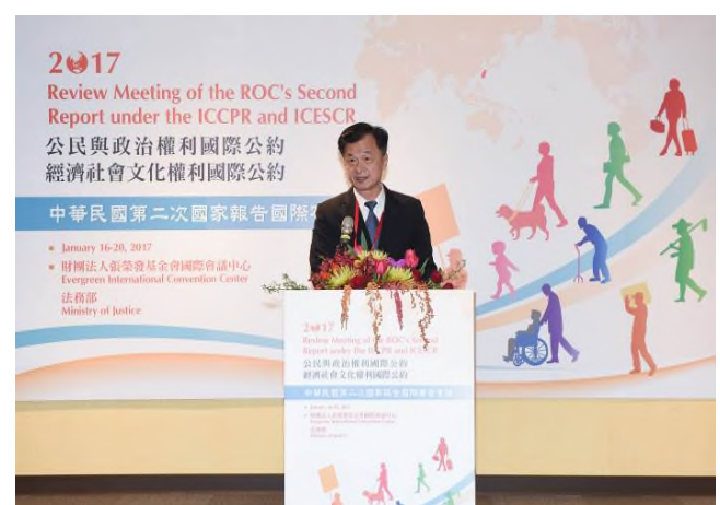
圖：左為 106 年 1 月 16 日陳前副總統建仁於兩公約第二次國家報告國際審查會議開幕式致詞 右為 106 年 1 月 16 日法務部邱前部長太三於兩公約第二次國家報告國際審查會議開幕式致詞