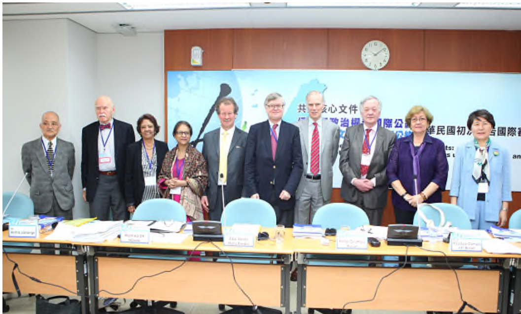
圖：102 年 2 月 25 日國際審查專家合影(由左至右：京都大學人權研究所所長安藤仁介 (Nisuke Ando)、紐約大學法學院教授孔傑榮 (Jerome A. Cohen)、聯合國發展計劃性別平等任務編組委員戴瑞恩 (Shanthi Dairiam)、巴基斯坦最高法院律師公會會長亞罕吉兒 (Asma Jahangir)、奧地利維也納大學法學院教授諾瓦克 (Manfred Nowak)、德國曼海姆大學教授瑞德爾 (Eibe Riedel)、紐約大學法學院教授及人權與全球正義中心共同主任奧斯頓 (Philip G. Alston)、荷蘭馬斯垂克大學法學院國際法榮譽教授范博文 (Theodoor Cornelis van Boven)、聯合國人權與國際團結獨立專家丹旦 (Virginia Bonoan-Dandan)、聯合國經濟社會文化權利委員會委員申蕙秀 (Heisoo Shin))