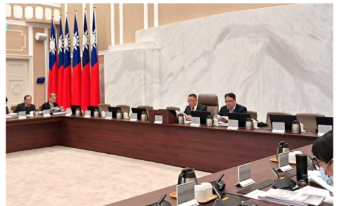
圖：兩公約第四次國家報告內容，於行政院人權保障推動小組第49次委員會議通過（行政院林政務委員明昕擔任召集人、法務部黃前政務次長世杰擔任副召集人）