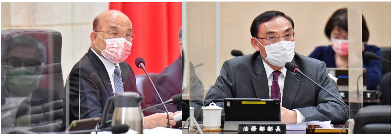
圖:左為行政院蘇前院長貞昌於 111 年 5 月 5 日第 3801 次會議裁示通過我國首部國家人權行動計畫。右為法務部蔡前部長清祥於 111 年 5 月 5 日第 3801 次會議說明我國首部國家人權行動計畫之制定。

績效:我國首部國家人權行動計畫由行政院羅前政務委員秉成及林前政務委員萬億共同邀集政府機關、民間團體、專家學者召開多次會議,進行研商討論,共同盤點我國應優先推動、促進、保護之重大人權議題,並擬定具體改善之行動及應達成之關鍵績效指標,以確保落實改善相關人權缺失。前後撰寫過程耗時近 4 年,持續整合各界意見,不斷地折衝協調後,終於 111 年 5 月 5 日經行政院第 3801 次會議通過,對外正式發表。列入該行動計畫應優先推動之八大人權議題分別為:一、強化人權保障體制、二、人權教育、三、平等與不歧視、四、生命權保障、五、居住正義、六、氣候變遷與人權、七、數位人權、八、難民權利保障,各權責機關須著手行動,以確實改善與民眾切身相關之人權缺失,落實相關人權議題之基本權利保障。我國首部國家行動計畫之制定,除回應國內各界長期之倡議外,並符合聯合國鼓勵各會員國制定行動計畫之國際人權保障思潮,更落實我國人權立國之政策目標。