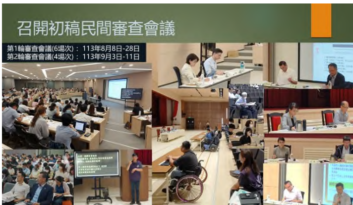
圖：兩公約第四次國家報告初稿期間，共辦理10場次民間審查會議