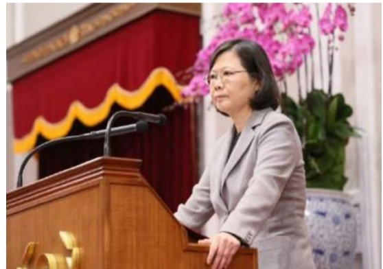
圖：105年4月25日馬前總統英九主持 兩公約第二次國家報告發表記者會