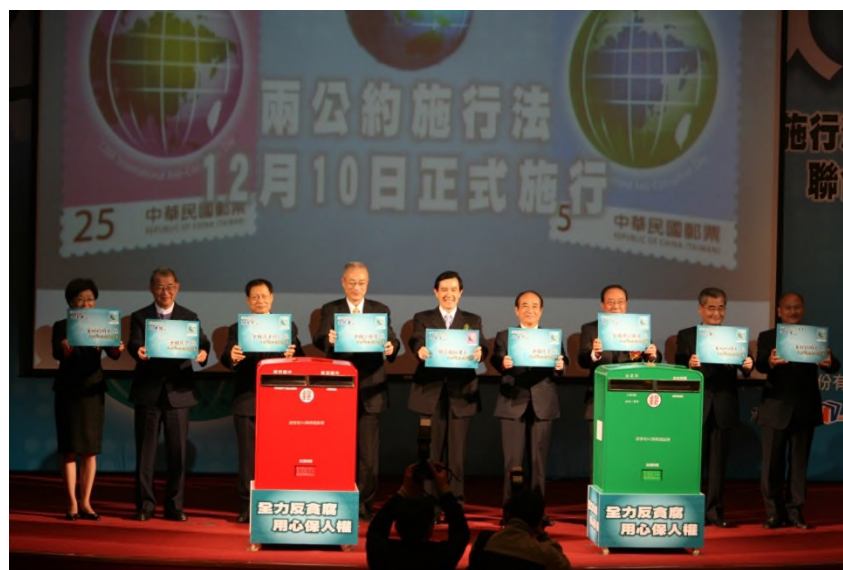
圖: 98 年 12 月 9 日馬前總統及五院院長親臨反貪倡廉郵票發行暨公政公約及經社文公約施行法施行聯合典禮

績效: 立法院於 98 年 3 月 31 日完成兩公約施行法三讀程序,經馬前總統於 98 年 4 月 22 日公布,行政院並將兩公約施行法定自 98 年 12 月 10 日施行。98 年 12 月 9 日法務部與交通部、中華郵政股份有限公司假國家圖書館舉辦「全力反貪腐 用心保人權—反貪倡廉郵票發行暨公政公約及經社文公約施行法施行聯合典禮」,馬前總統及五院院長親臨與會,以彰顯政府反貪腐及保障人權決心。