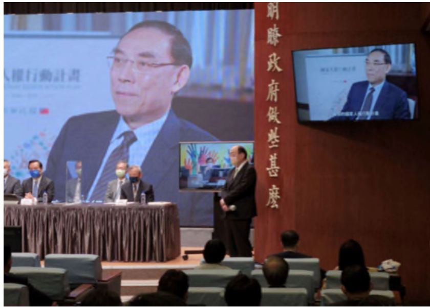
圖：111年5月5日行政院召開國家人權行動計畫記者發表會