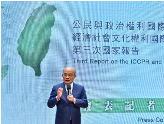
圖：109年6月29日行政院蘇前院長貞昌蒞臨兩公約第三次國家報告發表記者會致詞

關主動就落實兩公約保障個人享有之人權狀況，進行初步檢視並積極採取相關精進作為之效益，俾以改善我國人權缺失，提升人權標準；讓世界看見我國雖然已非聯合國會員國，但政府與民間仍不斷為促進及保障人權而努力，以具體行動展現我國與世界人權接軌，自願落實國際人權標準之決心。