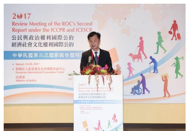
圖：左為 106 年 1 月 16 日陳前副總統建仁於兩公約第二次國家報告國際審查會議開幕式致詞 右為 106 年 1 月 16 日法務部邱前部長太三於兩公約第二次國家報告國際審查會議開幕式致詞