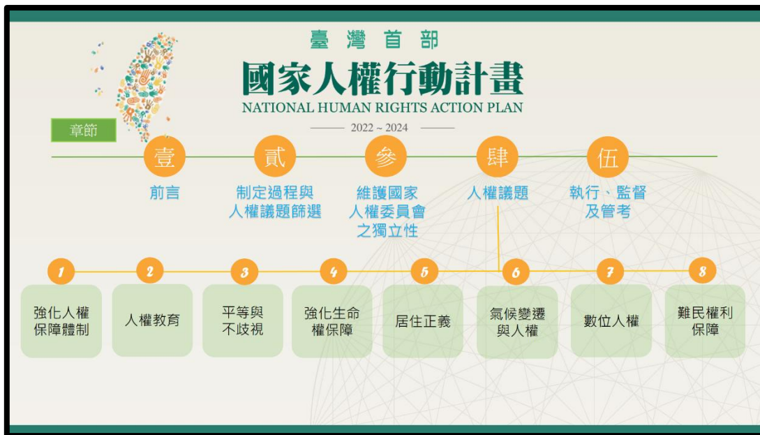
圖：我國首部國家人權行動計畫囊括八大人權議題