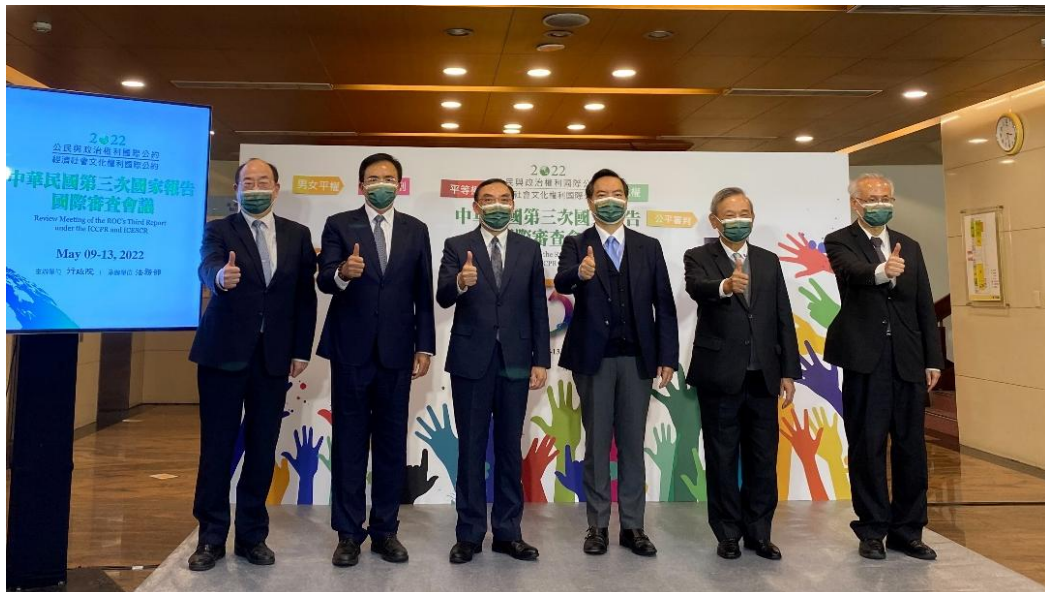
圖：111年5月4日第三次國家報告國際審查會前宣傳記者會合影

三、第三次國家報告國際審查：為期三天之審查會議中，專家們逐條審查我國提出的國家報告、民間團體平行報告、問題清單回應等資料，期間專家們、政府機關、民間團體進行三方對話及交流。會後專家們提出「92點結論性意見與建議」，分為緒論、共通議題、經社文公約權利落實情形、公政公約權利落實情形等4大議題。兩委員會在第1部分說明我國施行兩公約、撰寫歷次兩公約國家報告、辦理國際審查會議之過程及結論性意見產生的方式，肯定我國政府及民間團體積極的參與；第2部分至第4部分則係兩審查委員會針對涉及兩公約之共通人權議題、經社文公約及公政公約所保障權利於我國落實推動情形所提出之觀察，並從政策、法令及執行等不同面向提出建議，例如核心人權公約國內法化、國家人權行動計畫後續執行、監督及評估與適足住房及土地權、原住民族健康、死刑議題、假消息之刑罰及社會秩序維護法處罰。爾後將持續追蹤管考各政府機關落實本次結論性意見與建議，持續將兩公約的精神具體實踐於所有政府施政，使我國人權保障標準接軌國際，厚實我國人權立國之根基。