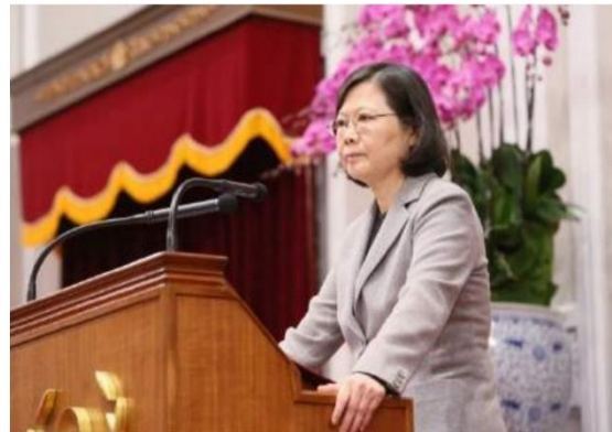
圖：105年4月25日馬前總統英九主持 兩公約第二次國家報告發表記者會