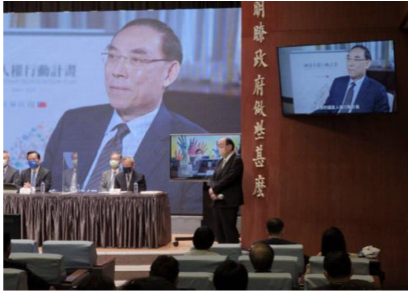
圖：111年5月5日行政院召開國家人權行動計畫記者發表會