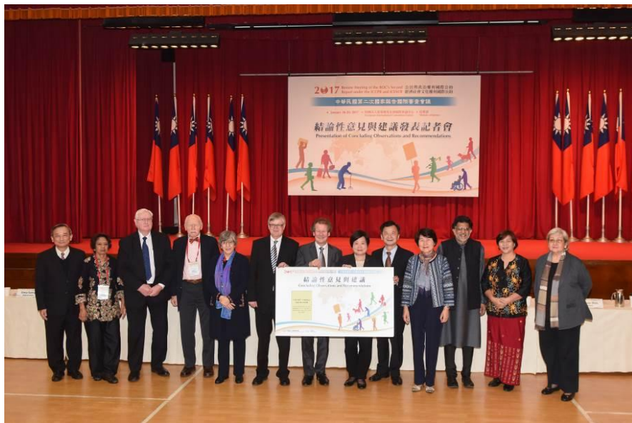
圖：106年1月20日結論性意見與建議發表記者會大合影

二、第二次國家報告國際審查：第二次國家報告國際審查會議期間，專家們就兩公約逐條進行審查，與我國政府機關代表及來自國內外的人權團體透過對話的方式進行廣泛且深入的討論，範圍包括原住民、身心障礙者、婦女、兒童、新住民及外籍移工等弱勢族群權益保障，及國家人權機構之設置、平等與反歧視、死刑、勞工權益保障、反迫遷與土地正義等我國重要人權議題，並於會後提出「78點結論性意見與建議」。法務部亦已擬具「兩公約第二次國家報告國際審查會議結論性意見與建議之落實及管考規劃」方案，提報總統府人權諮詢委員會第27次委員會議確認通過。依上述落實及管考規劃方案，於106年8月30日至同年11月15日期間，由行政院或各點次主辦機關分別召開第一階段民間參與審查回應表會議，共計21場次；復於106年12月20日至107年1月16日期間，由總統府人權諮詢委員會下設之「公民與政治權利國際公約小組」、「經濟社會文化權利國際公約小組」及「共通議題及其他核心人權公約小組」，分別召開第二階段回應表審查會議，共計8場次。各點次主辦機關所擬改善78點結論性意見與建議缺失之回應內容，業提報至總統府人權諮詢委員會第31次委員會議確認通過，並由法務部結合行政院國發會之作業系統，請各權責機關定期填報辦理情形，進行追蹤管考。