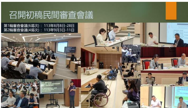
圖：兩公約第四次國家報告初稿期間，共辦理10場次民間審查會議