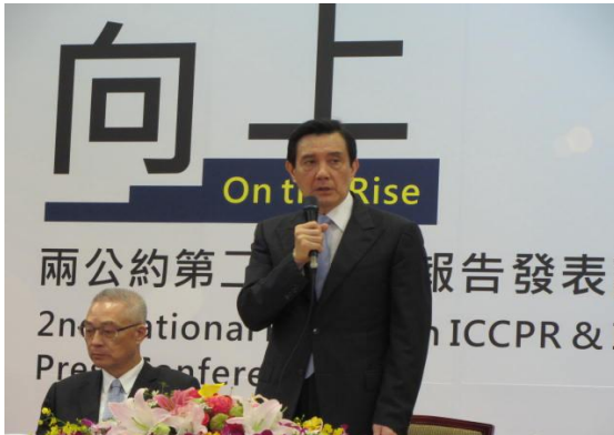
圖：105年4月25日馬前總統英九主持 兩公約第二次國家報告發表記者會