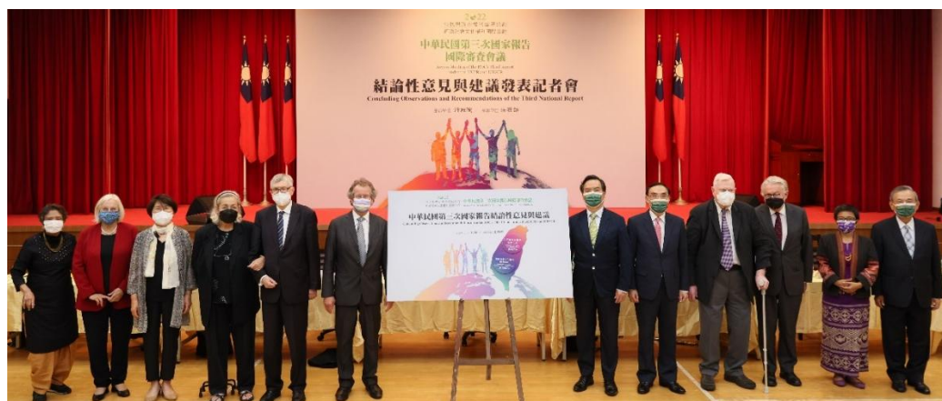
圖：111年5月13日結論性意見與建議發表記者會大合影