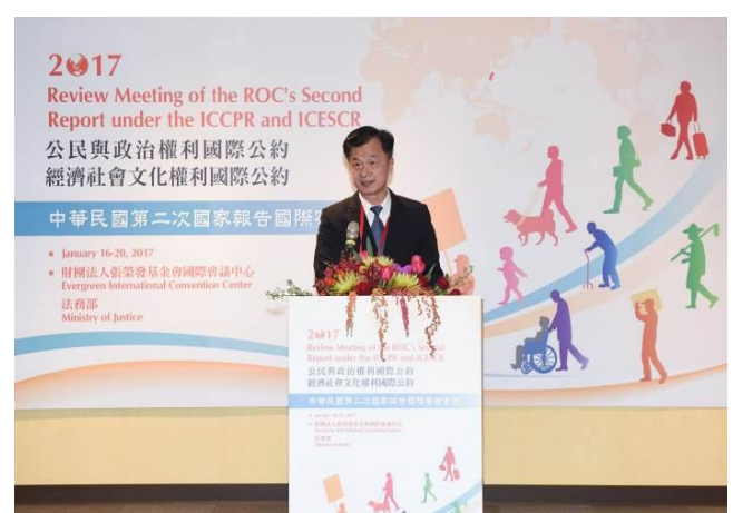
圖：左為 106 年 1 月 16 日陳前副總統建仁於兩公約第二次國家報告國際審查會議開幕式致詞 右為 106 年 1 月 16 日法務部邱前部長太三於兩公約第二次國家報告國際審查會議開幕式致詞