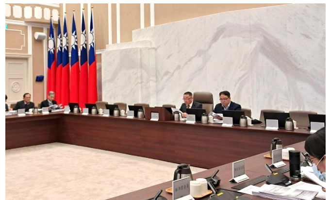
圖：兩公約第四次國家報告內容，於行政院人權保障推動小組第 49 次委員會議通過（行政院林政務委員明昕擔任召集人、法務部黃政務次長世杰擔任副召集人）