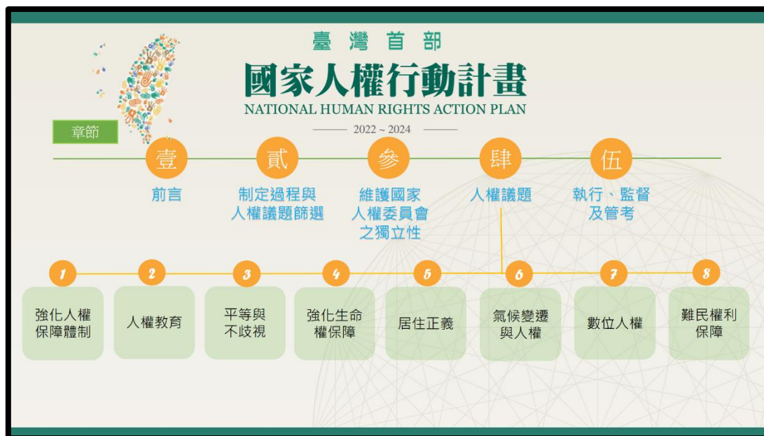
圖：我國首部國家人權行動計畫囊括八大人權議題