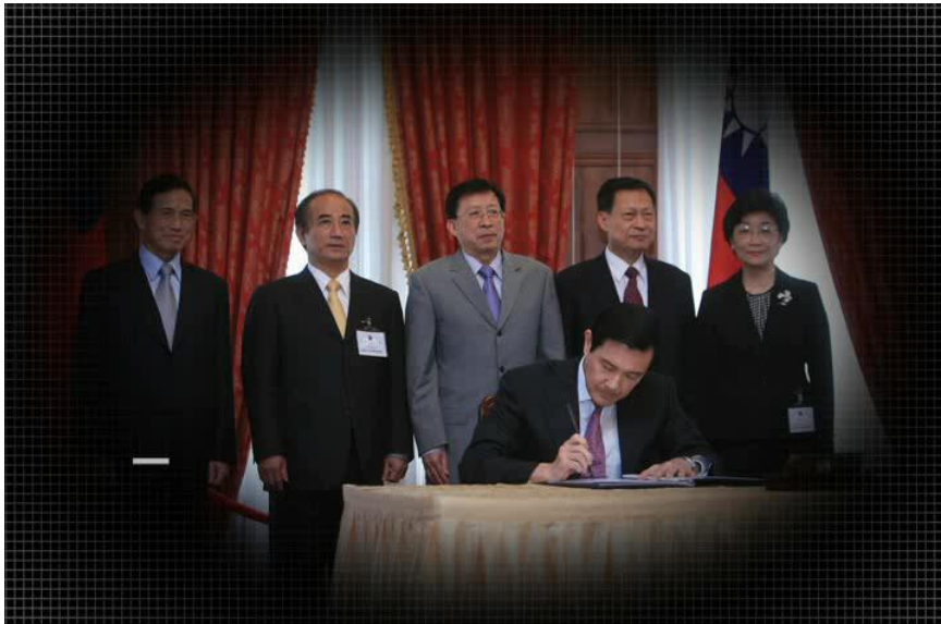
圖：98 年 5 月 14 日馬前總統簽署公政公約及經社文公約批准書

績效：在行政院之積極推動下，立法院於 98 年 3 月 31 日完成公政公約及經社文公約審議，馬前總統並於 98 年 5 月 14 日完成批准公政公約及經社文公約。