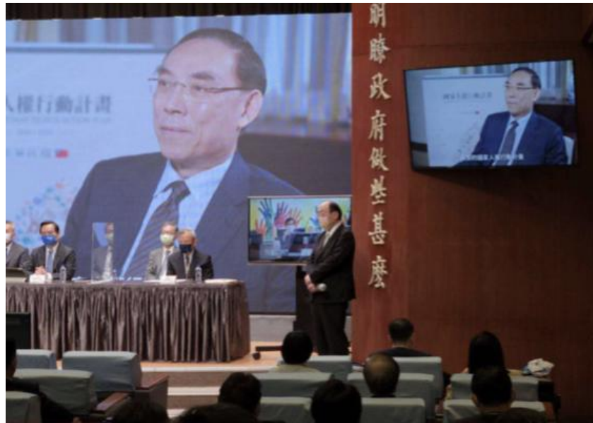
圖：111 年 5 月 5 日行政院召開國家人權行動計畫記者發表會