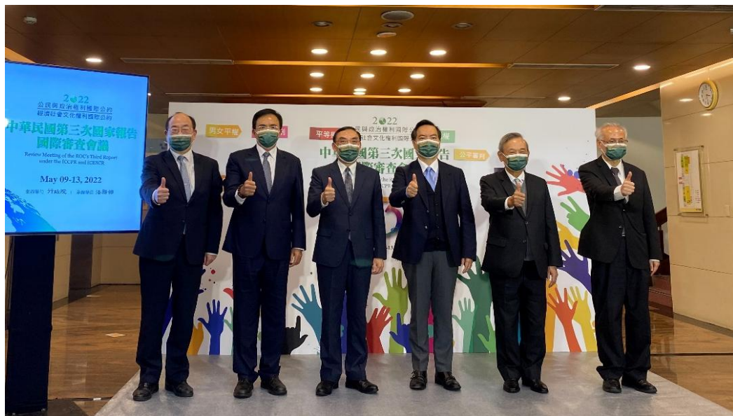
圖：111年5月4日第三次國家報告國際審查會前宣傳記者會合影

三、第三次國家報告國際審查：為期三天之審查會議中，專家們逐條審查我國提出的國家報告、民間團體平行報告、問題清單回應等資料，期間專家們、政府機關、民間團體進行三方對話及交流。會後專家們提出「92點結論性意見與建議」，分為緒論、共通議題、經社文公約權利落實情形、公政公約權利落實情形等4大議題。兩委員會在第1部分說明我國施行兩公約、撰寫歷次兩公約國家報告、辦理國際審查會議之過程及結論性意見產生的方式，肯定我國政府及民間團體積極的參與；第2部分至第4部分則係兩審查委員會針對涉及兩公約之共通人權議題、經社文公約及公政公約所保障權利於我國落實推動情形所提出之觀察，並從政策、法令及執行等不同面向提出建議，例如核心人權公約國內法化、國家人權行動計畫後續執行、監督及評估與適足住房及土地權、原住民族健康、死刑議題、假消息之刑罰及社會秩序維護法處罰。爾後將持續追蹤管考各政府機關落實本次結論性意見與建議，持續將兩公約的精神具體實踐於所有政府施政，使我國人權保障標準接軌國際，厚實我國人權立國之根基。