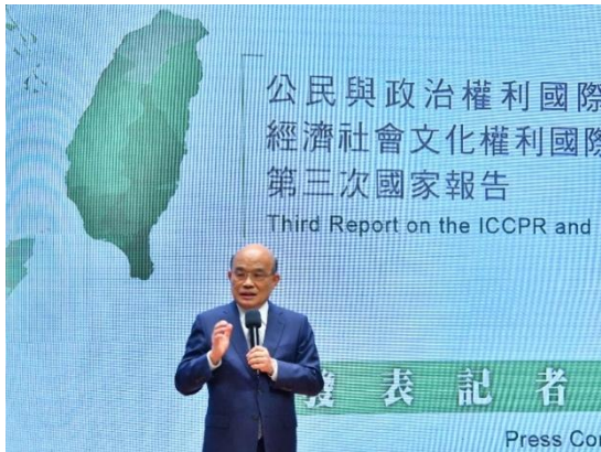
圖：109 年 6 月 29 日行政院蘇院長貞昌蒞臨兩公約第三次國家報告發表記者會致詞

關主動就落實兩公約保障個人享有之人權狀況，進行初步檢視並積極採取相關精進作為之效益，俾以改善我國人權缺失，提升人權標準；讓世界看見我國雖然已非聯合國會員國，但政府與民間仍不斷為促進及保障人權而努力，以具體行動展現我國與世界人權接軌，自願落實國際人權標準之決心。