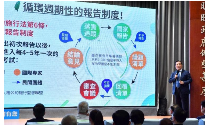
圖：109 年 6 月 29 日羅政務委員秉成說明第三次國家報告撰寫歷程及報告期間人權重大進展與後續國際審查規劃