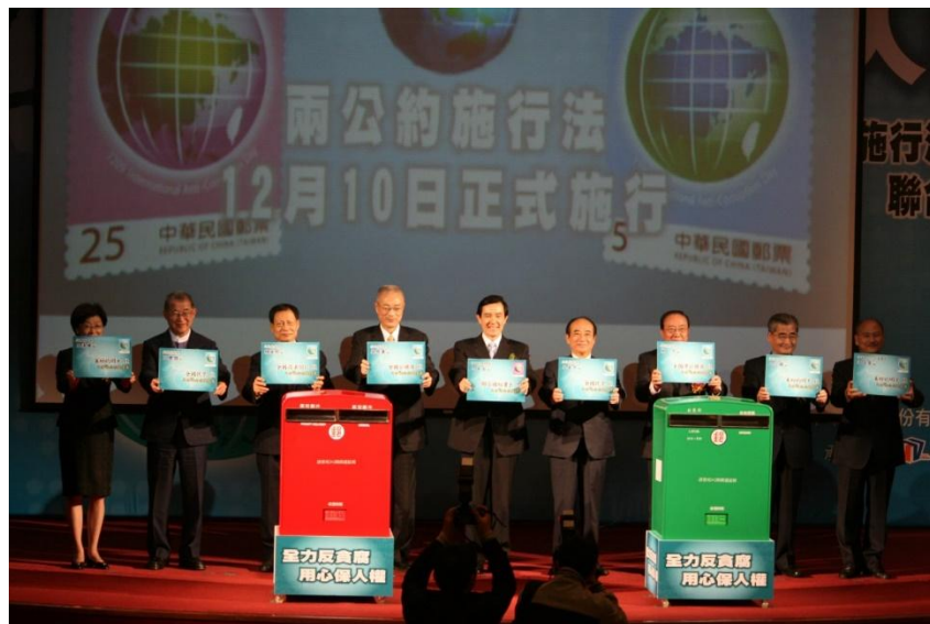
圖: 98 年 12 月 9 日馬前總統及五院院長親臨反貪倡廉郵票發行暨公政公約及經社文公約施行法施行聯合典禮

績效:立法院於 98 年 3 月 31 日完成兩公約施行法三讀程序,經馬前總統於 98 年 4 月 22 日公布,行政院並將兩公約施行法定自 98 年 12 月 10 日施行。98 年 12 月 9 日法務部與交通部、中華郵政股份有限公司假國家圖書館舉辦「全力反貪腐 用心保人權—反貪倡廉郵票發行暨公政公約及經社文公約施行法施行聯合典禮」,馬前總統及五院院長親臨與會,以彰顯政府反貪腐及保障人權決心。