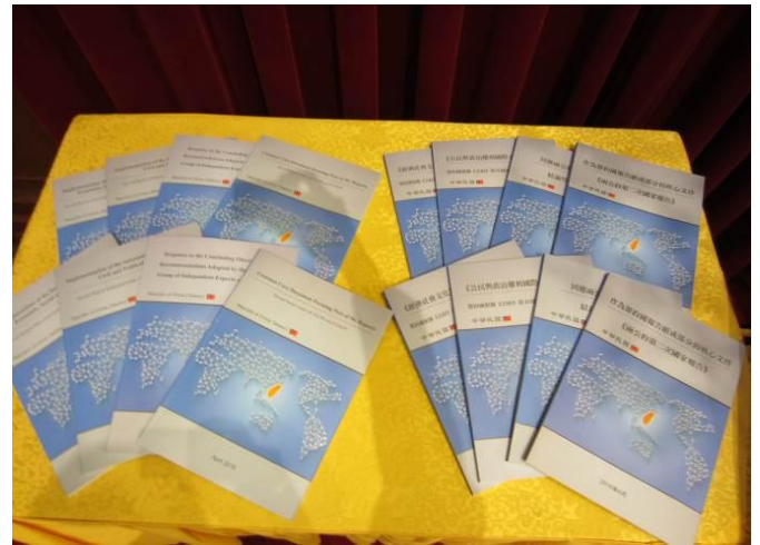
圖：左為兩公約初次國家報告，右為第二次國家報告