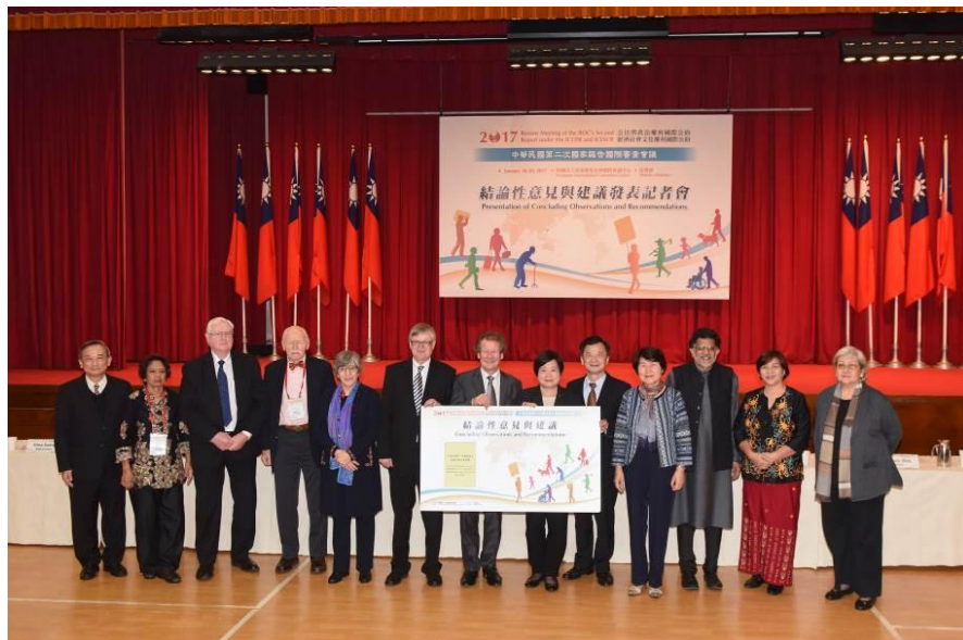
圖：106 年 1 月 20 日結論性意見與建議發表記者會大合影

二、第二次國家報告國際審查：第二次國家報告國際審查會議期間，專家們就兩公約逐條進行審查，與我國政府機關代表及來自國內外的人權團體透過對話的方式進行廣泛且深入的討論，範圍包括原住民、身心障礙者、婦女、兒童、新住民及外籍移工等弱勢族群權益保障，及國家人權機構之設置、平等與反歧視、死刑、勞工權益保障、反迫遷與土地正義等我國重要人權議題，並於會後提出「78 點結論性意見與建議」。法務部亦已擬具「兩公約第二次國家報告國際審查會議結論性意見與建議之落實及管考規劃」方案，提報總統府人權諮詢委員會第 27 次委員會議確認通過。依上述落實及管考規劃方案，於 106 年 8 月 30 日至同年 11 月 15 日期間，由行政院或各點次主辦機關分別召開第一階段民間參與審查回應表會議，共計 21 場次；復於 106 年 12 月 20 日至 107 年 1 月 16 日期間，由總統府人權諮詢委員會下設之「公民與政治權利國際公約小組」、「經濟社會文化權利國際公約小組」及「共通議題及其他核心人權公約小組」，分別召開第二階段回應表審查會議，共計 8 場次。各點次主辦機關所擬改善 78 點結論性意見與建議缺失之回應內容，業提報至總統府人權諮詢委員會第 31 次委員會議確認通過，並由法務部結合行政院國發會之作業系統，請各權責機關定期填報辦理情形，進行追蹤管考。