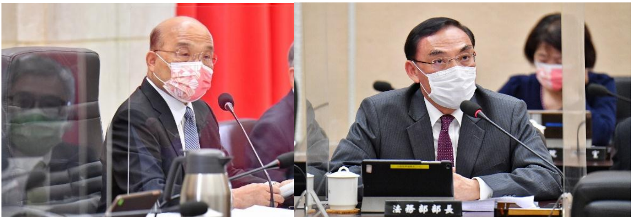
圖：左為行政院蘇院長貞昌於 111 年 5 月 5 日第 3801 次會議裁示通過我國首部國家人權行動計畫。 右為法務部蔡部長清祥於 111 年 5 月 5 日第 3801 次會議說明我國首部國家人權行動計畫之制定。

績效：我國首部國家人權行動計畫由行政院羅政務委員秉成及林政務委員萬億共同邀集政府機關、民間團體、專家學者召開多次會議，進行研商討論，共同盤點我國應優先推動、促進、保護之重大人權議題，並擬定具體改善之行動及應達成之關鍵績效指標，以確保落實改善相關人權缺失。前後撰寫過程耗時近 4 年，持續整合各界意見，不斷地折衝協調後，終於 111 年 5 月 5 日經行政院第 3801 次會議通過，對外正式發表。列入該行動計畫應優先推動之八大人權議題分別為：一、強化人權保障體制、二、人權教育、三、平等與不歧視、四、生命權保障、五、居住正義、六、氣候變遷與人權、七、數位人權、八、難民權利保障，各權責機關須著手行動，以確實改善與民眾切身相關之人權缺失，落實相關人權議題之基本權利保障。我國首部國家行動計畫之制定，除回應國內各界長期之倡議外，並符合聯合國鼓勵各會員國制定行動計畫之國際人權保障思潮，更落實我國人權立國之政策目標。