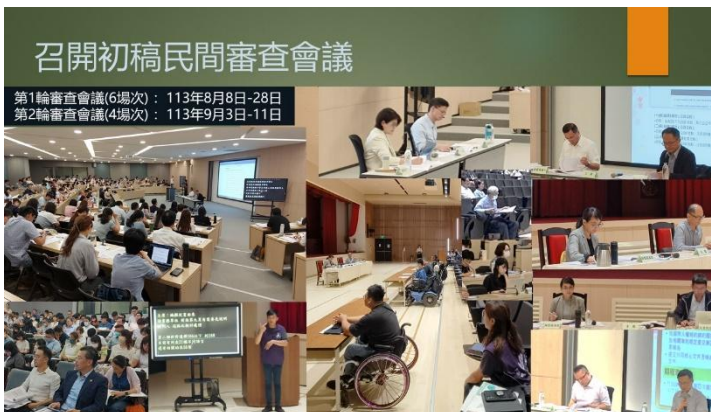
圖：兩公約第四次國家報告初稿期間，共辦理 10 場次民間審查會議