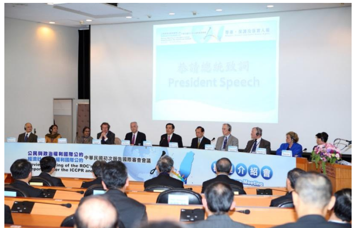
圖：102 年 2 月 24 日馬前總統英九、吳前副總統敦義、曾前部長勇夫出席中華民國初次人權報告國際審查會議歡迎介紹會

內容：我國於 101 年 4 月 20 日完成並發表初次國家人權報告，因我國已非聯合國會員國，無法依聯合國模式提交報告及接受審查，乃獨創自行邀請國際人權專家來臺參與國際審查會議之模式，分別於 102 年 2 月 25 日至 27 日，及 106 年 1 月 16 日至 18 日由 10 位國際人權專家，來臺進行初次及第二次國家報告之國際審查。並延續此一模式於 111 年 5 月 9 日至 13 日再次邀請 9 位國際人權專家來臺進行第三次國家報告之國際審查。3 次之國際審查會議，國際人權專家就我國政府機關與民間團體提出之國家報告、平行報告與問題清單之回應及平行回應等資料，及公民社會關注之議題，與政府機關代表及民間團體交換意見、展開建設性對話，希藉此機會協助改善我國人權現況及提供建議，藉此建立國際人權對話平臺，俾與國際人權體系接軌。