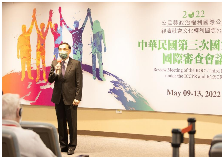
圖：111年5月9日法務部蔡部長清祥於兩公約第三次國家報告國際審查會議開幕式致詞